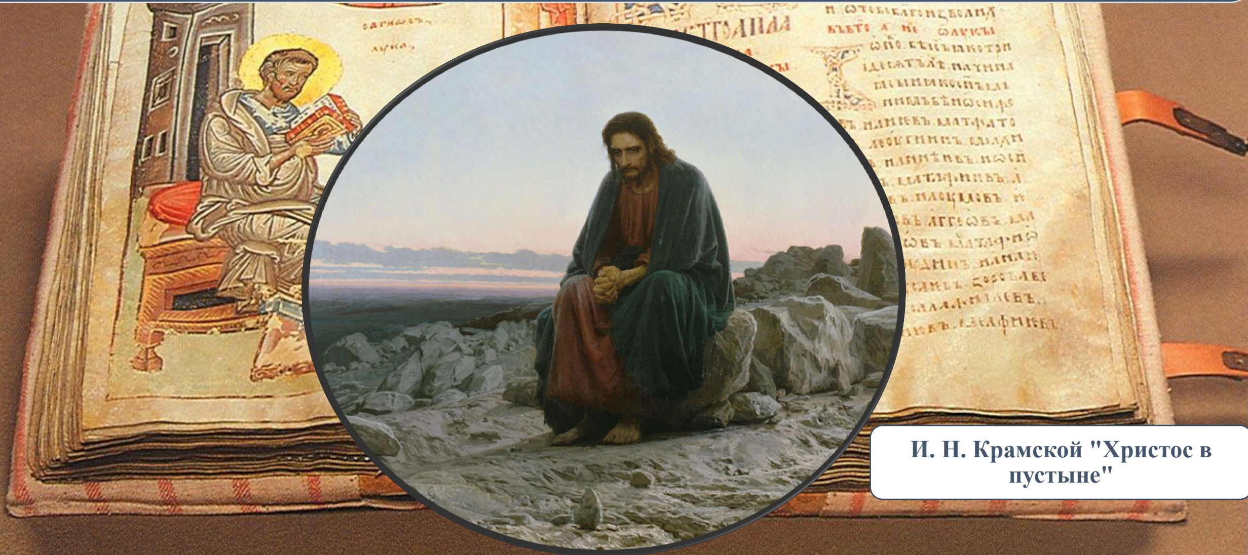
И. Н. Крамской "Христос в пустыне"