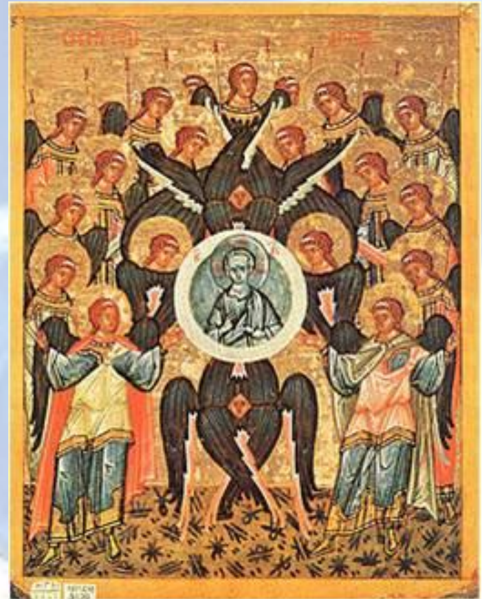
(новгородская икона, конец XV века)